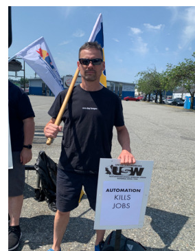
Des membres de notre bureau District 3 sont venus en nombre pour se solidariser avec nos confrères / consœurs de l'ILWU.

À cœur des revendications de l'ILWU se trouvait le besoin urgent de reconnaître les défis auxquels sont confrontés les travailleurs/travailleuses en ce qui concerne le coût de la vie. Alors que les bénéfices des entreprises montent en flèche, la disparité entre les moyens de subsistance des travailleurs/travailleuses et la prospérité des entreprises membres de la BCMEA reste une préoccupation flagrante.