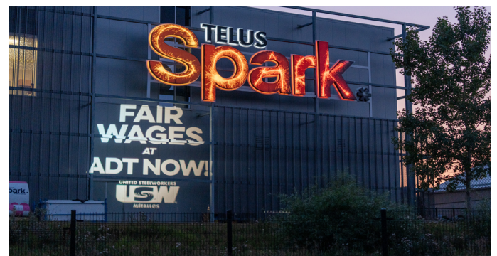
Le "bat-light" du Syndicat des Métallos projetant un message clair "Des salaires équitables chez ADT maintenant" sur le bâtiment du Telus Spark Science Centre et sur le Scotiabank Saddledome.