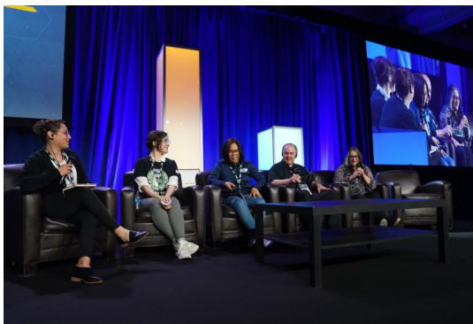
Panel sur la mobilisation pour un avenir meilleur