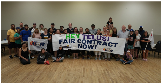
Des membres d'ADT et du Syndicat des Métallos lors d'un barbecue à Calgary, organisé en soutien aux travailleurs/travailleuses d'ADT et à leur Comité de négociation.