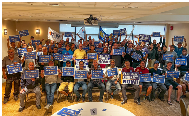
Les délégués et les membres de l'Unité 60 lors de la réunion publique du mardi 4 juillet à Vancouver.

un nombre minimum d'employés et une durée minimale pour obtenir un contrat. En d'autres termes, cela signifie que les sous-traitants bénéficient d'une plus grande sécurité d'emploi que les membres du Syndicat des Métallos. D'autres explications de la compagnie ont montré qu'elle cherchait à améliorer l'efficacité du système d'acheminement. Le fait qu'un entrepreneur ayant un ordre de travail puisse effectuer un ordre de service à proximité rendrait le routage plus efficace, selon eux. Ceux d'entre nous qui ont vécu la débâcle du routage automatisé au cours de la dernière décennie savent que les inefficacités existaient bien avant 2018. Nous sommes fermement opposés à l'idée de renoncer à la sécurité de l'emploi pour permettre à la compagnie de tester une nouvelle théorie sur la meilleure façon d'améliorer la productivité de son logiciel de routage.