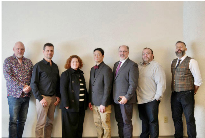
Membres du Comité de négociation

La mobilisation a été forte lors des réunions publiques de l'unité 60 organisées fin juin et début juillet par les membres du Comité de négociation pour faire le point sur l'état d'avancement des négociations. Le processus général de négociation a été rappelé aux participants avant que les détails de notre cycle actuel ne soient développés. Nous nous souvenons tous de la bataille acharnée qui nous a menés au bord de l'action syndicale en 2018 pour obtenir un libellé juridictionnel sur le travail de service pour la classification des installateurs, mais les membres ont été informés de l'objectif actuel de l'employeur de récupérer ce travail et ont eu un aperçu des raisons. Sous pression, l'équipe de négociation de la compagnie a laissé entendre qu'il était beaucoup plus difficile de se procurer des services de sous-traitance de nos jours. Les entreprises contractantes tirent parti de la demande pour leurs services en exigeant