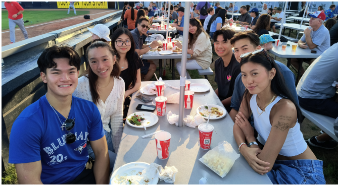
Des membres de l'Unité 60 et leurs familles profitent d'un match de baseball lors du barbecue de la "Journée annuelle au stade".