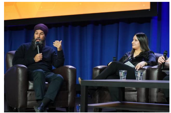
Le chef du NPD, Jagmeet Singh, a fait quelques remarques lors d'une séance de discussion.