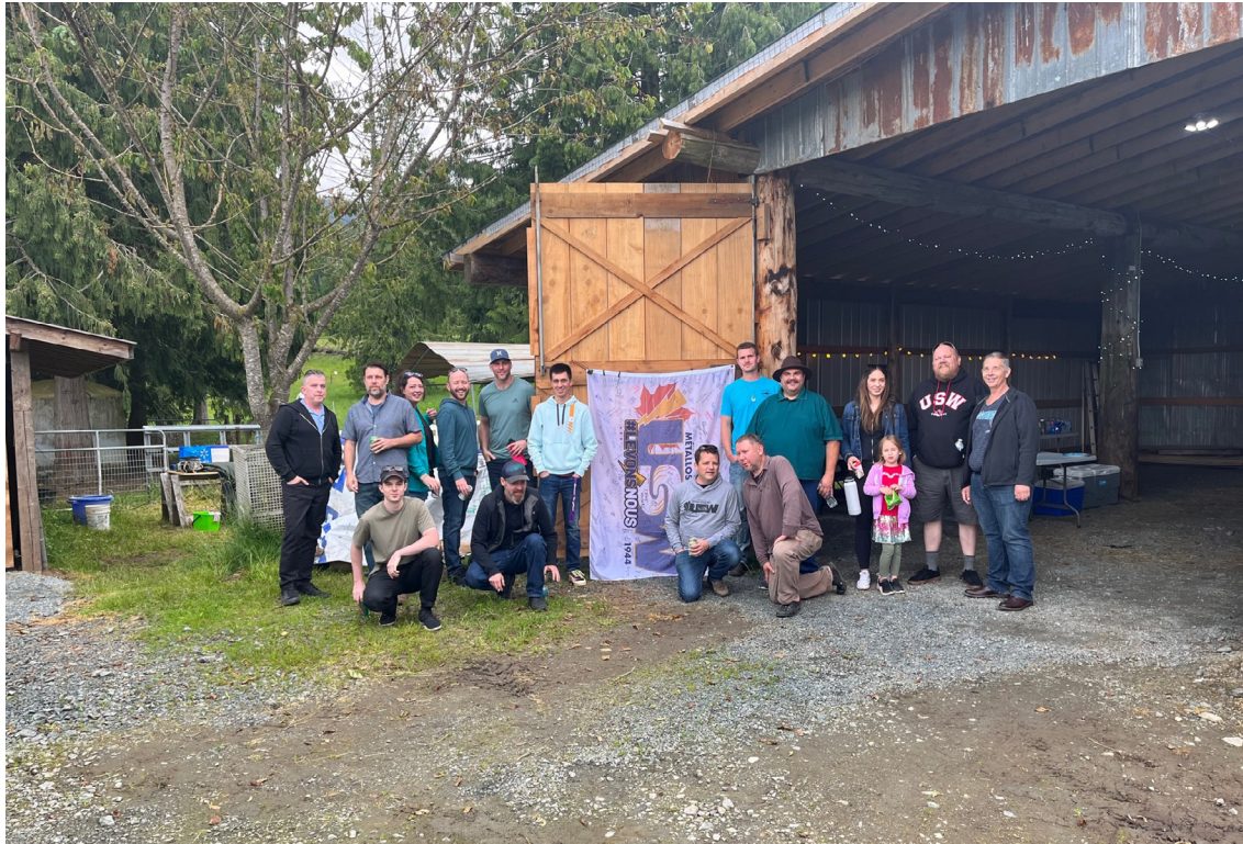
Unité 32- Abbotsford/Mission Usine

Consultez USW1944.CA pour les mises à jour sur le drapeau et quand il arrivera à votre unité.