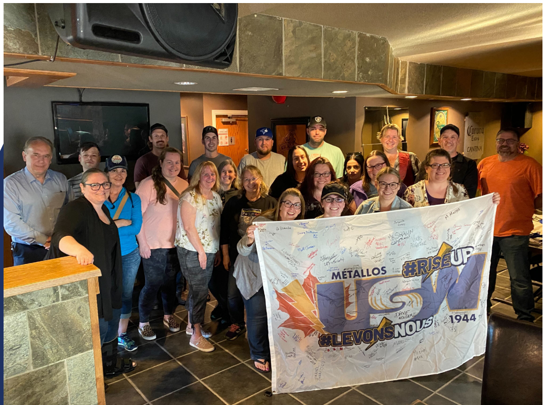
Unité 53 - Prince George Clérical, Usine, Traffic

Consultez USW1944.CA pour les mises à jour sur le drapeau et quand il arrivera à votre unité.