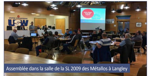
Assemblée dans la salle de la SL 2009 des Métallos à Langley