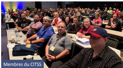
Membres du CITSS