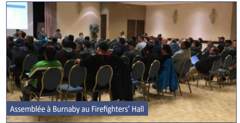
Assemblée à Burnaby au Firefighters' Hall

Merci à tous les membres qui ont pris sur leur temps libre pour assister à ces assemblées. Lorsque des changements doivent être décidés, il est important que vous preniez part au processus de décision. Votre voix compte, faites-la entendre !