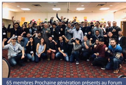
65 membres Prochaine génération présents au Forum