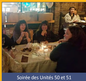
Soirée des Unités 50 et 51

Envoyez vos photos à communications@usw1944.ca