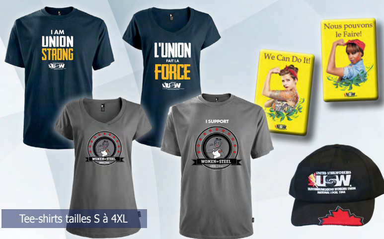
Tee-shirts tailles S à 4XL