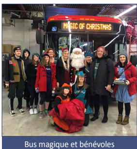
Bus magique et bénévoles