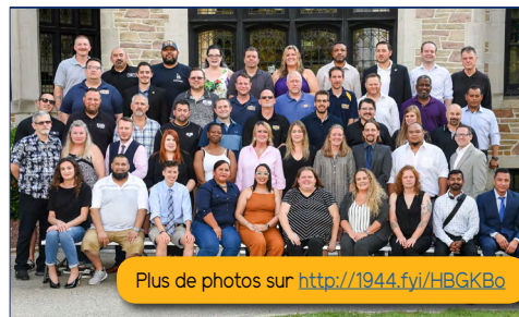
Plus de photos sur http://1944.fyi/HBGKBo