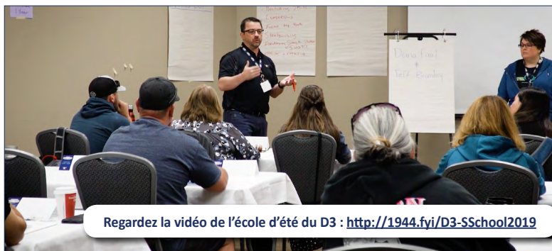
Regardez la vidéo de l'école d'été du D3 : http://1944.fyi/D3-SSchool2019