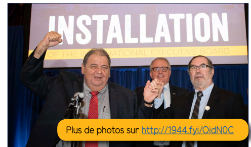
Plus de photos sur http://1944.fyi/OidNOC

Quel sujet vous a le plus inspirée ? J'ai eu le privilège d'assister, avec ma classe PPL, à l'installation du nouveau Bureau exécutif international des Métallos. Le syndicat se veut diversifié et inclusif, c'est pourquoi il était d'autant plus formidable de voir ce changement s'opérer au niveau de l'exécutif, avec l'arrivée de deux nouvelles femmes. En tant que jeune activiste Grochaine Génération occupant un poste dans un centre d'appels, j'ai été soulagée de constater que notre nouveau Bureau exécutif se concentre sur des sujets importants affectant nos jeunes générations, tels que l'intelligence artificielle, qui est préoccupant pour les emplois futurs.