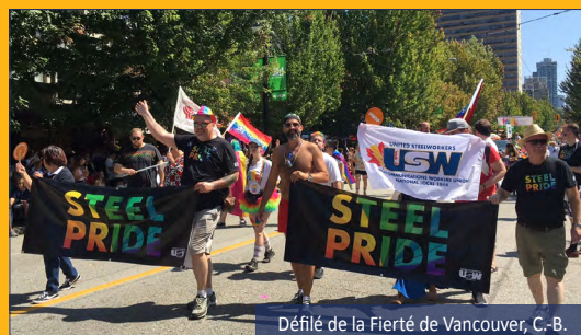
Défilé de la Fierté de Vancouver, C.-B.

Envoyez-nous vos photos de votre participation aux événements de la Fierté à photos@usw1944.ca